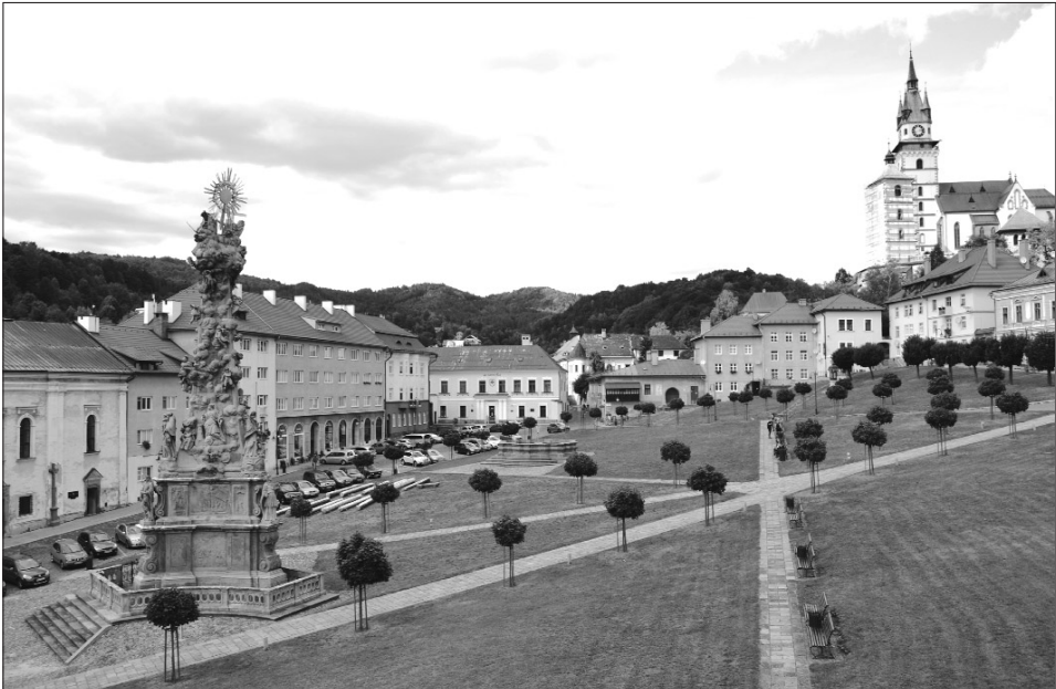
Kremnica – námestie