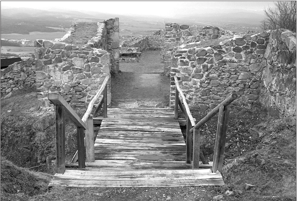
Zvolenský Pustý hrad

Viacero pozitívnych novinových článkov o Pavlovi Križkovi v miestnej i regionálnej tlači a stúpajúci záujem samotných Kremničanov o osud Velestúrskej skaly sa odrazilo v snahe usporiadať ďalšiu konferenciu venovanú tajomným nápisom nad Kremnicou.