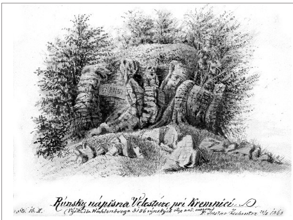
Kresba G. K. Zechentera Laskomerského

Považujem Zechenterovu kresbu za dôkaz autentickosti velestúrskeho nápisov.